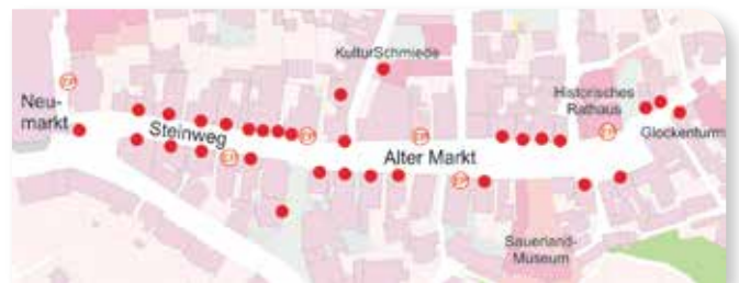
Router Steinweg - Alter Markt

Als eine der ersten Städte Nordrhein-Westfalens hat Arnsberg aktiv den Aufbau eines freien, bürgerschaftlich getragenen WLAN-Netzes unterstützt, das jetzt nach und nach auf das gesamte Stadtgebiet ausgedehnt wird. Dass Besucher, Touristen wie auch Bürger insbesondere im historischen Arnsberg nun gratis und sicher mit ihren Smartphones im Netz surfen können, ist dem Engagement vieler bürgerschaftlicher Akteure aus dem Einzelhandel, der Hotellerie und Gastronomie, dem Verkehrsverein Arnsberg e.V. und vielen interessierten Bürgerinnen und Bürgern in Zusammenarbeit mit dem Freifunk Rheinland e.V. zu verdanken.