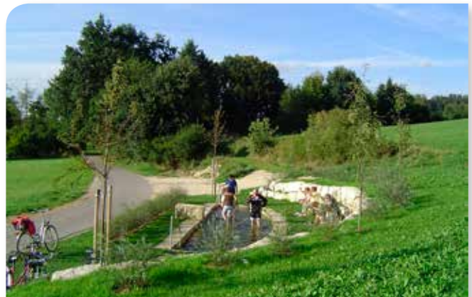
Kneippbecken am Zusam-Radweg bei Zusamzell

Die reizvolle Landschaft im ursprünglichen Zusamtal und einer Vielzahl von begleitenden Bachtälern im „Naturpark Augsburg Westliche Wälder“ in Kombination mit der Nähe zur A8 lassen eine Ausrichtung auf Fremdenverkehr als sinnvoll erscheinen.