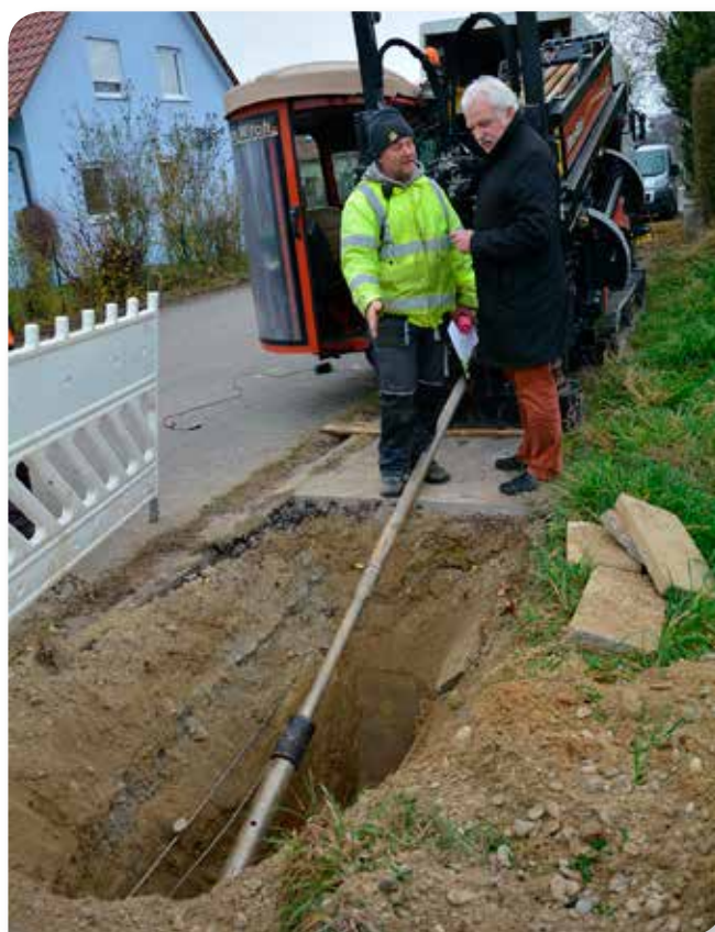
Leitungsverlegung im Spühlbohrverfahren

Gemeindegebiet in drei Lose aufgeteilt und versorgt