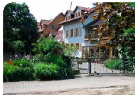
Maria Ward Haus für Seminare und Übernachtungen

Altenmünster liegt an einem attraktiven Radwegenetz, das in den letzten Jahren mit dem Bau von vier Radwegen ergänzt wurde und demnächst mit fünf weiteren Radwegen vervollständigt werden soll. Im Bayernnetz für Radler ist die Gemeinde bereits als Radwegeknoten dargestellt.