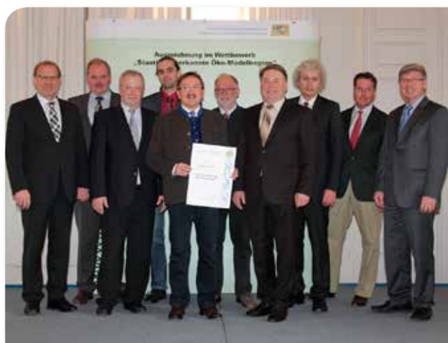
Staatsminister Brunner überreichte die Urkunde zur anerkannten bayerischen Ökomodellregion

Flexibilität und einer naturnahen Bewirtschaftungsform, gepaart mit einer hohen Nachfrage der Verbraucher, kann diesen Strukturwandel gestalten und Arbeitsplätze erhalten.