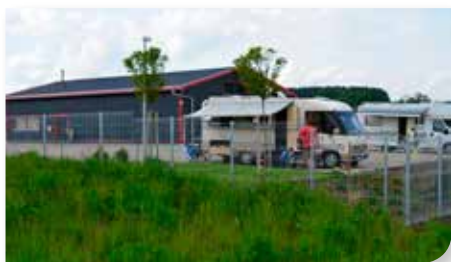
Wohnmobilpark mit etwa 50 Stellplätzen

Zwei Schullandheime weisen hohe Übernachtungszahlen auf, besonders das „Bruder-Klaus-Heim“ mit Volkssternwarte und Eichholzsee der Diözese Augsburg im Wallfahrtsort Violau. Ein Schullandheim der Stadt Augsburg befindet sich in Zusamm, direkt an der Zusam.