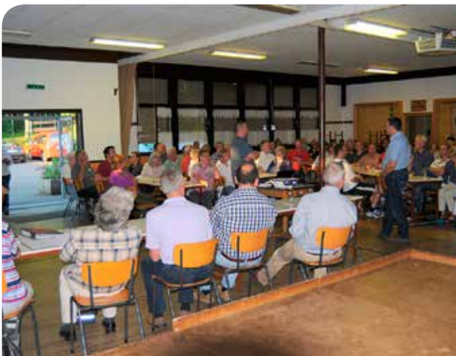
Viel Zuspruch bei der Beitrittsveranstaltung

(1) Erste Gespräche mit Besitzern, (2) Idee der Weiterführung der Kneipe, (3) Prüfung verschiedener Rechtsformen, (4) Wirtschaftlichkeitsprüfung mit Brauerei, (5) Koordination mit Behörden und Ämtern, (6) Kontakt zum Genossenschaftsverband, (7) Erstellung der Satzung, (8) Konkretisierung Pacht, Ablauf, (9) Erstellung Fünf-Jahres Wirtschaftsplan, (10) Gründung der Genossenschaft, (11) Beitrittsveranstaltung.