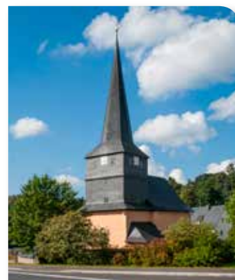
Die Wehrkirche St. Johannes Baptista in Steinbach am Wald ist eines der Wahrzeichen der Gemeinde