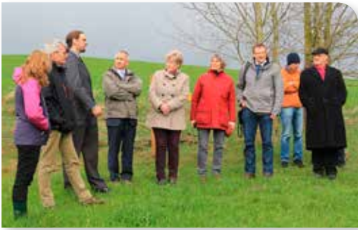
Besuch der Ökomodellregion Steinwald durch den bayerischen Landtag

Erfahrene Projektmitarbeiter erarbeiten Ziele und Projekte, die passgenau auf die Ökomodellregion Steinwald abgestimmt sind. Arbeitskreise mit Landwirten und Vermarkter, Bio-Kochkurse für die interessierte Öffentlichkeit und die innovative Entwicklung neuer Bioprodukte (z.B. Topinambur-Pralinen) sind nur einige Beispiele. Ökolandwirte und an der Umstellung interessierte Landwirte können sich zum Anbau von Sonderkulturen und zur Wiedereinführung des „Roten Höhenviehs“, einer alten heimischen Hausrindrasse mit bester Fleischqualität, informieren. Die „Friedenfelder Betriebe“ etwa stellten als Modellbetrieb 130 Hektar landwirtschaftliche Fläche auf Ökolandbau um, legten laufend alle Erfahrungen damit offen und schufen mit einem Bio-Lagerhaus beste strukturelle Voraussetzungen einer Wertschöpfungskette in der Region.