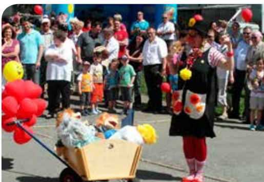
Stadtfest für „Lebens- qualität für Generationen“

Für die Kooperationsunternehmen wurden Beratungsgespräche, Workshops und Seminare und Infoveranstaltungen