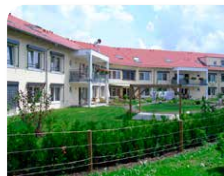
Seniorenpflegeheim Wohngruppenmodell von BeneVit

Ergebnis: Nach Jahren des Rückganges wurde eine Trendwende erreicht. Seit geraumer Zeit sind wachsende Einwohnerzahlen, stabile bis steigende Geburtenraten und eine Zunahme der Arbeitsplätze zu registrieren.