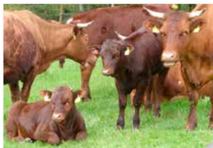
Das Rote Höhenvieh, eine alte Hausrindrasse vor allem der Mittelgebirgsregionen

Erfahrene Projektmitarbeiter erarbeiten Ziele und Projekte, die passgenau auf die Ökomodellregion Steinwald abgestimmt sind. Arbeitskreise mit Landwirten und Vermarkter, Bio-Kochkurse für die interessierte Öffentlichkeit und die innovative Entwicklung neuer Bioprodukte (z.B. Topinambur-Pralinen) sind nur einige Beispiele. Ökolandwirte und an der Umstellung interessierte Landwirte können sich zum Anbau von Sonderkulturen und zur Wiedereinführung des „Roten Höhenviehs“, einer alten heimischen Hausrindrasse mit bester Fleischqualität, informieren. Die „Friedenfelder Betriebe“ etwa stellten als Modellbetrieb 130 Hektar landwirtschaftliche Fläche auf Ökolandbau um, legten laufend alle Erfahrungen damit offen und schufen mit einem Bio-Lagerhaus beste strukturelle Voraussetzungen einer Wertschöpfungskette in der Region.