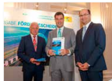
Finanz- und Heimatminister Söder übergibt Förderbescheid

Im Sommer 2015 sind dann alle neun Ortsteile (Altenmünster, Baiershofen, Eppishofen, Hegnenbach, Hennhofen, Neumünster, Unterschöneberg, Violau und Zusamzell) bis zum Kabelverzweiger versorgt, das heißt, zu einem Prozentsatz von weit über 90 können im gesamten Gemeindegebiet Einwohner und Betriebe Übertragungsraten von 50 MBit, mindestens aber 30 MBit nutzen. Vor diesem Ausbau hatten örtliche Unternehmer zunehmend schlechte Übertragungsraten kritisiert. Inzwischen ist dies nicht mehr der Fall, positive Rückmeldungen über die gute Anbindung mehren sich.