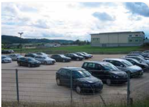
Gewerbegebiet Hennhofen, innerhalb von zehn Jahren fünf Betriebe mit 150 Beschäftigten

Die Gewerbegebiete in den drei Ortsteilen erlauben zudem eine gewisse Schwerpunktsetzung, sodass die Unternehmen des Baugewerbes und der Energietechnik entsprechend ihrer spezifischen Bedürfnisse von anderen Unternehmen, etwa aus den Bereichen Einzelhandel, Dienstleistung und Tourismus, getrennt werden konnten. Durch die Ansiedlung eines Vollsortimenters mit Tankstelle und Autowaschanlage sowie eines Getränkemarktes im Gewerbegebiet in Altenmünster konnte ein ganz maßgeblicher Beitrag zur Sicherung der Daseinsfürsorge geleistet werden. Die Betriebe ergänzen sich gegenseitig durch ihre verschiedenen Angebote.