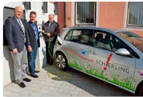
Die öffentliche Elektro-Tankstelle am Rathaus

Die Schierlinger Erfolge können sich durchaus sehen lassen: Schon vor Jahren wurde die Kläranlage so umgebaut, dass jährlich etwa 400000 Kilowattstunden Strom gespart werden. Der Kindergarten St. Michael wurde energetisch saniert mit der Folge einer 80 prozentigen Energieeinsparung. Für die teilweise Beheizung der Schule Schierling gibt es ein Contracting-System und im gemeindlichen Wohnhaus wurde ein Mini-Blockheizkraftwerk installiert. Eine öffentliche Elektro-Tankstelle ist am Rathaus installiert und ein geleastes Elektrofahrzeug steht für die Mitarbeiter bereit.