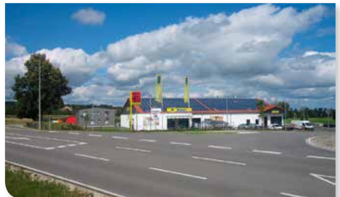
Gewerbegebiet Altenmünster, für Einzelhandel und Dienstleistung