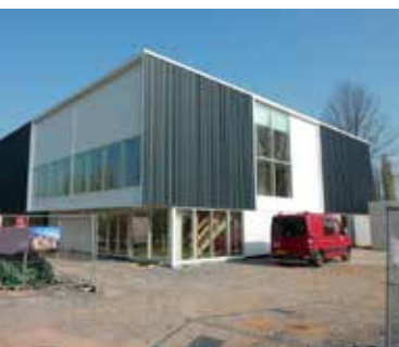
Neubau des Stadtbades