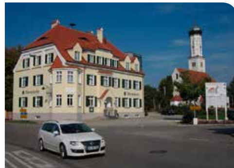
Brauereigaststätte im Gemeindebesitz, saniert, 28 Betten, Städtebauförderung

Der Gemeinde ist es gelungen, verschiedene Firmen in den Gewerbegebieten in drei Ortsteilen anzusiedeln. Nach der Insolvenz einer früheren Bau- und Bauschuttrecycling-Firma im Ortsteil Hennhofen konnte ein Marktführer im Bereich des Baus von Ziegelrolladenkästen angesiedelt werden. Zudem hat die Firma Beck & Heun ihre Belegschaft von zunächst 20 Beschäftigten auf 112 Angestellte erweitert. Zwei örtliche Unternehmen im Bereich Erdarbeiten und Bau-/Betonsanierung wurden auf den Insolvenzflächen angesiedelt. Zwei weitere einheimische Unternehmen aus den Bereichen Energietechnik und Kfz-Handel konnten ihre Entwicklung auf den durch Erweiterung des Gewerbegebietes angefügten Gewerbeflächen vor Ort sichern. Alle vier Betriebe aus der Gemeinde haben die Unternehmensnachfolge vor kurzem geregelt oder sind im Begriff, dies zusammen mit der im Betrieb tätigen nächsten Generation zu tun.