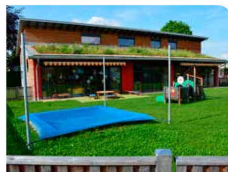
Neue Kinderkrippe in Holzbauweise mit Gründach, daneben der Kindergarten