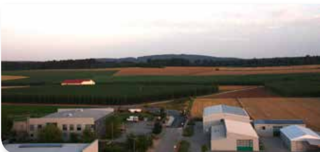
Gewerbegebiet Westliches Ende

Das Gewerbegebiet Haunstetten entstand, da ein Kfz-Betrieb aus einem Wohngebiet an den Ortsrand ausgesiedelt werden musste. Ein Kleintransportunternehmer und der Inhaber eines Kleinbetriebes, der im Keller eines Wohnhauses seine Firma gegründet hatte, wollten sich anschließen.