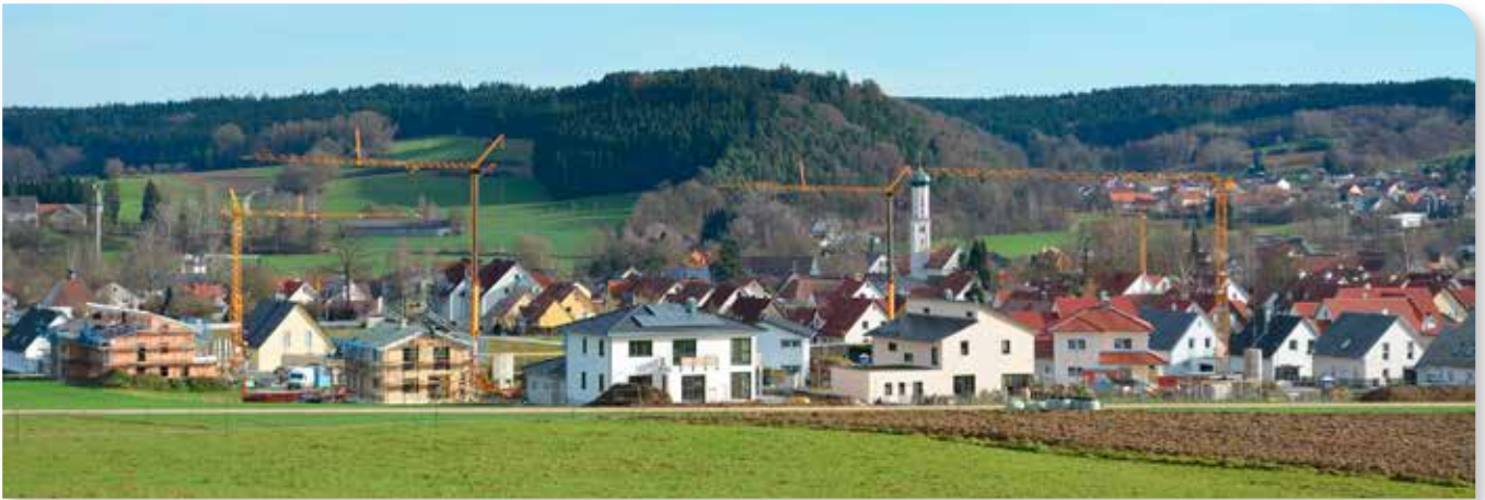
Bauboom im Baugebiet Brunnwiesfeld III – Preisvorteil für Einheimische und Familien mit Kindern